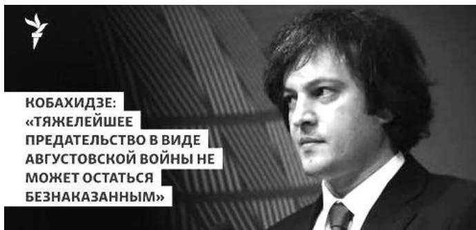
КОБАХИДЗЕ: «ТЯЖЕЛЕЙШЕЕ ПРЕДАТЕЛЬСТВО В ВИДЕ АВГУСТОВСКОЙ ВОЙНЫ НЕ МОЖЕТ ОСТАТЬСЯ БЕЗНАКАЗАННЫМ»

«Хочу подробно напомнить, какую выгоду получил Кремль и как Россия при участии прежнего руководства расширила своё военное присутствие и территориальное влияние в нашей стране. В 2004 году они предприняли первую попытку вторжения в Цхинвальский регион. Как-то удалось это урегулировать. С 2006 года начинаются интересные процессы. На основе действий,